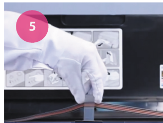
Установка СНПЧ. Рис. 5

9 Емкости доноры СНПЧ должны находится на высоте 8см от нижнего края принтера (рис. 7).