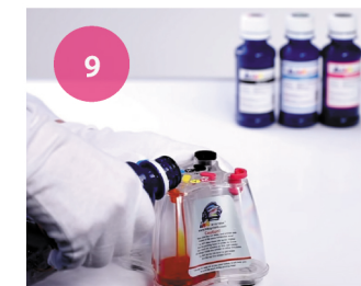
Заправка СНПЧ. Рис. 9

3 По окончании заправки, закройте заправочные отверстия (рис.10) и откройте воздушные. На место заглушек необходимо установить воздушные фильтры (рис.2). Заглушки воздушных отверстий установите в специальные отверстия на заправочных для дальнейшей эксплуатации СНПЧ (транспортировка, заправка).