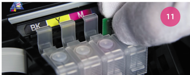
Обновление уровня чернил. Рис. 11

2 Зажмите кнопку обновления над картриджами на 5-7 секунд (рис. 11). Нажмите кнопку "капля". Установите блокировку датчика открытой крышки. Закройте крышку. Через несколько минут принтер будет готов к работе.