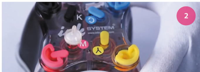
Установка СНПЧ. Рис. 2

2 Извлеките маленькие заглушки и аккуратно на их место установите воздушные фильтры (рис. 2). Обязательно сохраните заглушки для дальнейшей транспортировки принтера с установленной СНПЧ.