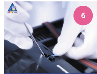
Установка СНПЧ. Рис. 6