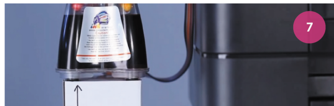
Установка СНПЧ. Рис. 7