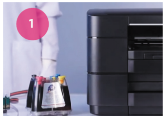
Установка СНПЧ. Рис. 1

1 Поставьте СНПЧ с левой стороны принтера (рис. 1) и расправьте шлейф. Проверьте порядок цветов на наклейке, расположенной на каретке печатающей головы, с цветными наклейками на картриджах. В случае несовпадения, порядок должен быть изменен!