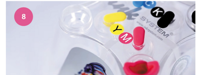
Заправка СНПЧ. Рис. 8

1 Для заправки СНПЧ закройте воздушные отверстия и откройте заправочные (рис. 8).