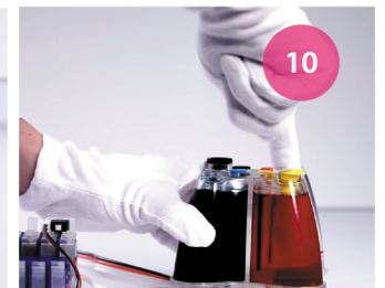
Заправка СНПЧ. Рис. 10