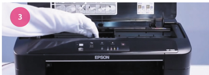
Установка СНПЧ. Рис. 3

4 Передвиньте каретку на середину (рис. 3).